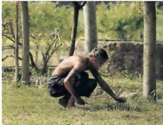
Los esclavos fueron esenciales en las explotaciones azucareras. r. c.

como en sus colonias, tuvo un papel esencial. La serie pone el foco en los puertos de Sevilla, Cádiz o Barcelona, «claves en el sistema internacional de la trata de esclavos».