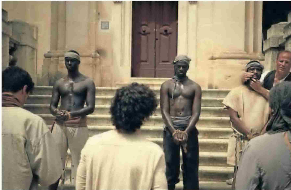
Fotograma de la serie en que se recrea el tráfico de esclavos. r. c.

Producida en colaboración con Lavinia Audiovisual, 'Encadenados' pone de relieve el esclavismo en la economía mundial y toma como partida la colonización de las Américas, donde España, tanto en la metrópolis