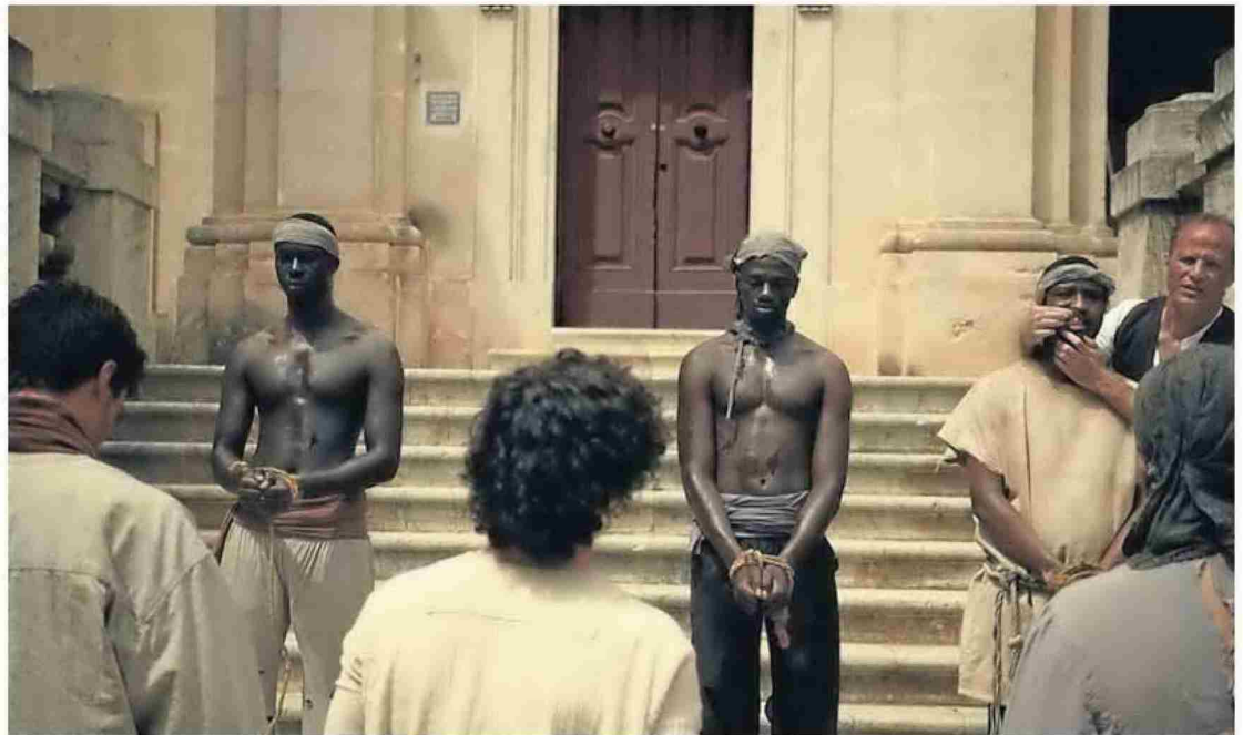
Un fotograma de la serie en la que se recrea el tráfico de esclavos. R. C.

Producida en colaboración con Lavinia Audiovisual, 'Encadenados' pone de relieve el esclavismo en la economía mundial y toma como partida la coloniza-