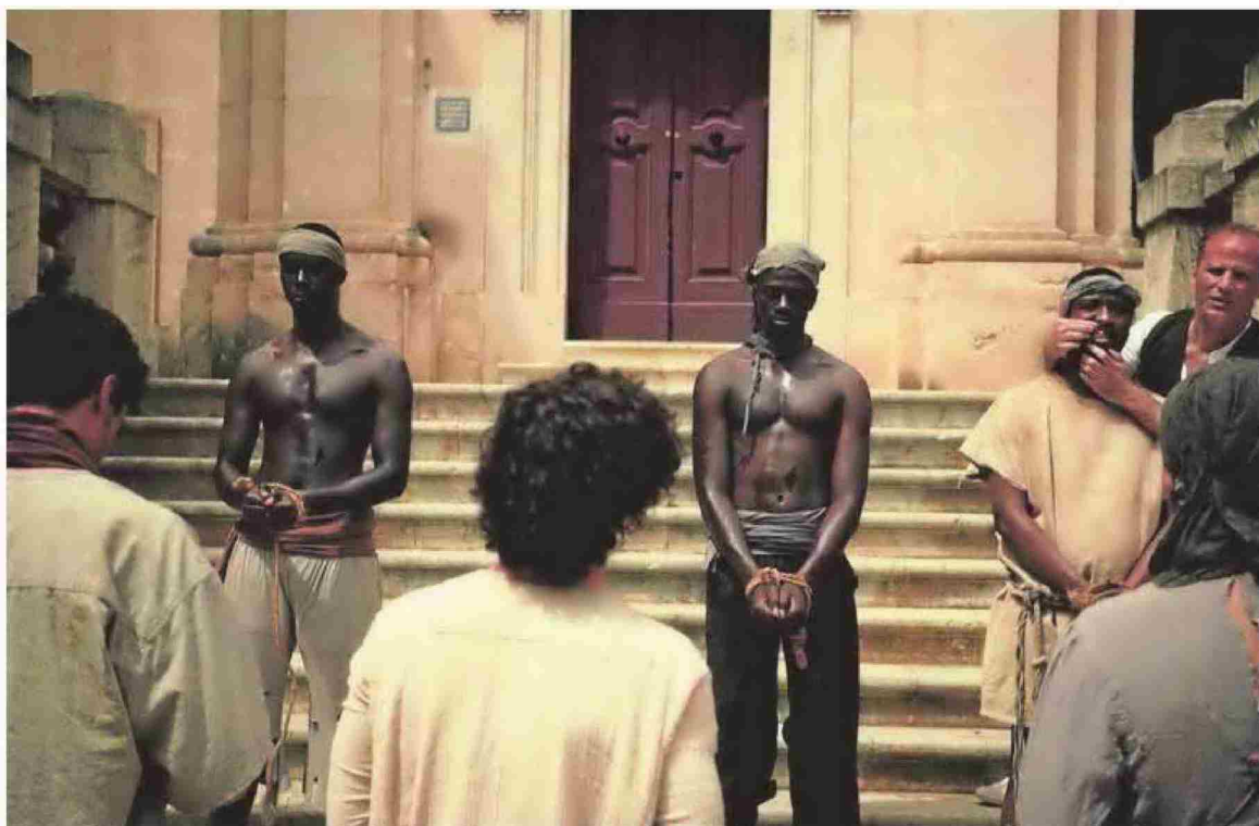
Fotograma de la serie en que se recrea el tráfico de esclavos.

Producida en colaboración con Lavinia Audiovisual, 'Encadenados' pone de relieve el esclavismo en la economía mundial y toma como partida la colonización de las Américas, donde España, tanto en la metrópolis