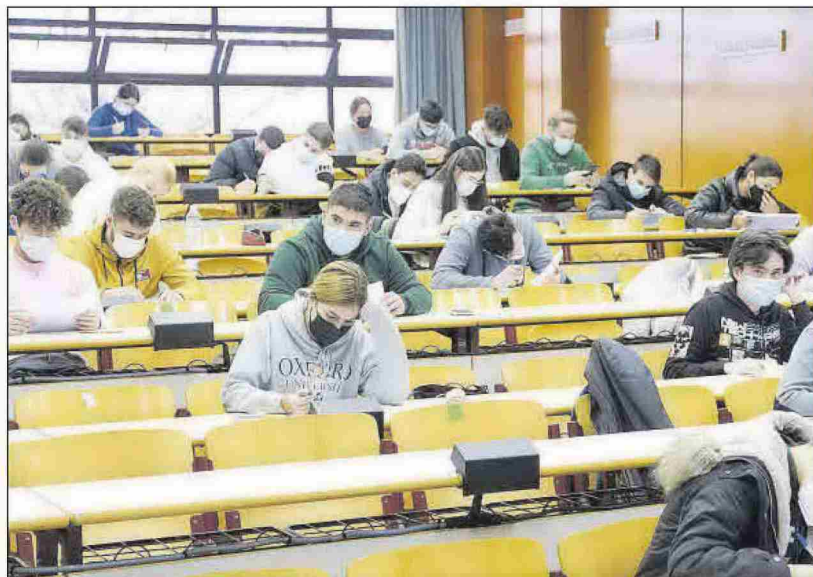
Un grupo de estudiantes realiza un examen en la Universidad de Alicante, el pasado enero.

► 2021 cerró con el récord de estudiantes en Alicante desde que hay datos: 128.100 ► 53.400 tienen trabajo o lo buscan, el segundo peor dato histórico