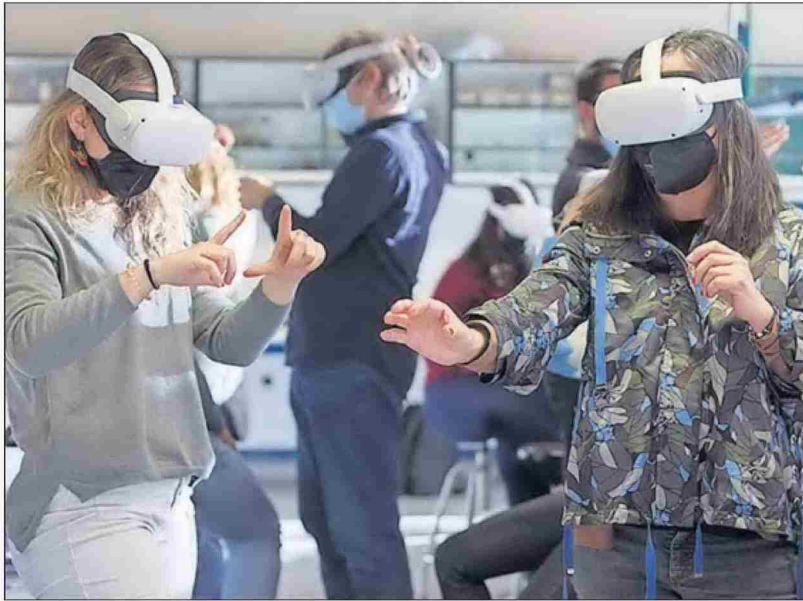
Un momento de la sesión práctica de realidad virtual en el máster de Profesorado de Educación Secundaria, el 17 de enero, en una imagen de la Universidad Pública de Navarra.

La demanda del máster para ser docente desborda la oferta de la universidad pública