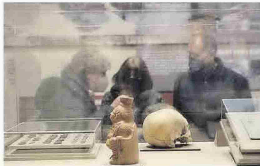
'Passat i present', a La Nau amb motiu del centenari.

«Passat i present. 100 anys fent arqueologia a la Universitat», organitzada per la Universitat de València, a través del Vicerectorat de Cultura i el Departament de Prehistòria, Arqueologia i Història Antiga, amb la col·laboració del Museu de Prehistòria València, el Museu Arqueològic de Gandia, el Museu Ar-