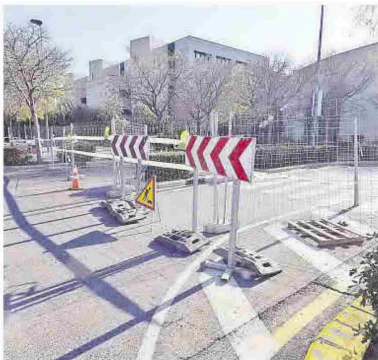
Corte al tráfico ante el inminente inicio de las obras del Jardí del Temps.

Asimismo, la UJI también está interviniendo en las facultades. En el caso de Jurídicas y Económicas, se hacen obras de rehabilitación energética para mejorar su eficiencia por un importe superior a 800.000 euros.