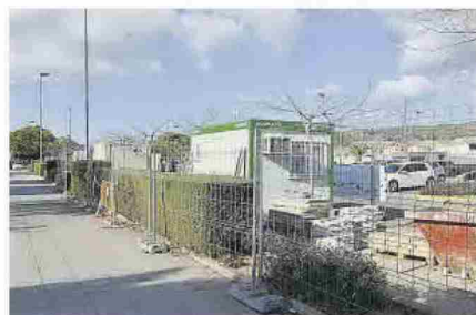
Otro emplazamiento donde se desarrollan trabajos.