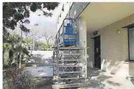
Rectorado de la Universitat Jaume I, donde se trabaja.