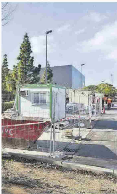
Obras frente a la Facultad de Jurídicas.