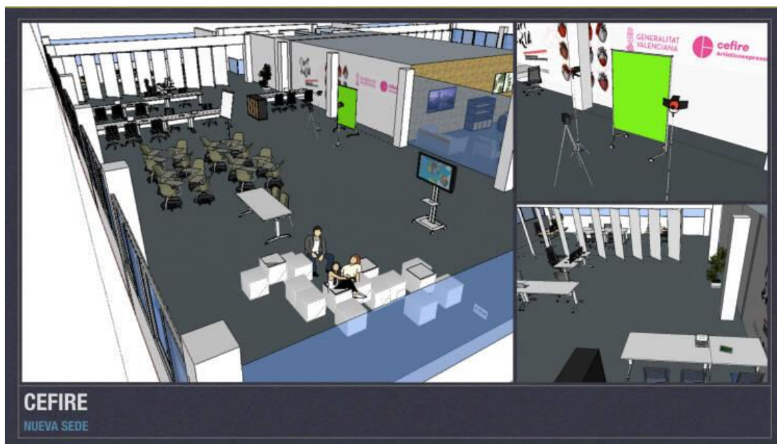
Propuesta conceptual de diseño Cefire Castelló

Asimismo, el CIETD albergará la nueva sede del Centro de Formación, Innovación y Recursos para el profesorado (Cefire) de Castelló , que ocupará previsiblemente toda la primera planta del edificio para facilitar el acceso al tener un uso más público que el resto de espacios. Para ello se diseñará un espacio con 600 metros cuadrados de superficie.