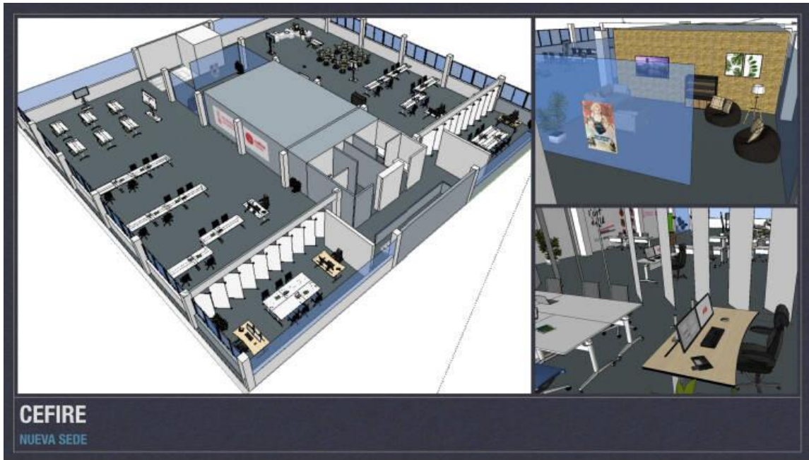
Propuesta conceptual de diseño Cefire Castelló

Del mismo modo, el nuevo centro deberá contar con espacios diáfanos para una futura ampliación, así como espacios generales: vestíbulo de entrada, conserjería, aulas, aula de futuro, zona de encuentro, espacios de reunión informal, salas de reunión y videoconferencia, aseos, almacenes o cuartos de limpieza.