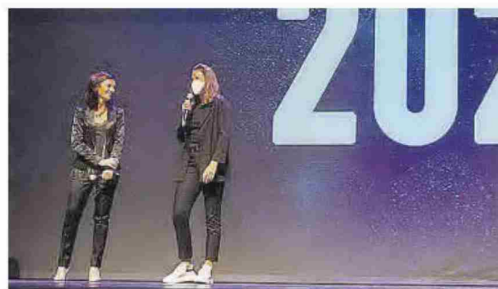
Sara Sorribes disfrutó con unas imágenes suyas de los Juegos Olímpicos.