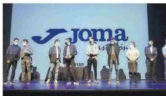
En la gala entregaron muchos vales de material deportivo Joma.