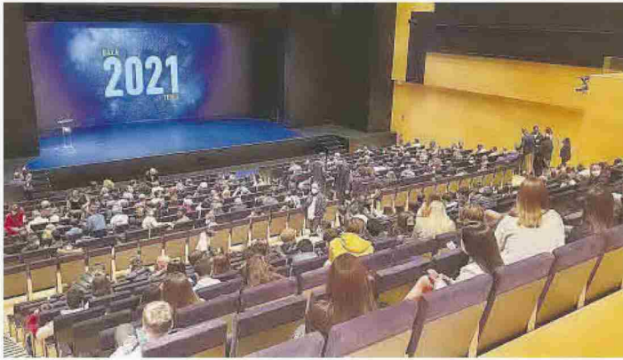
El deporte provincial llenó el Paraninf de la UJI para no faltar a la Gala del Tenis 2021.