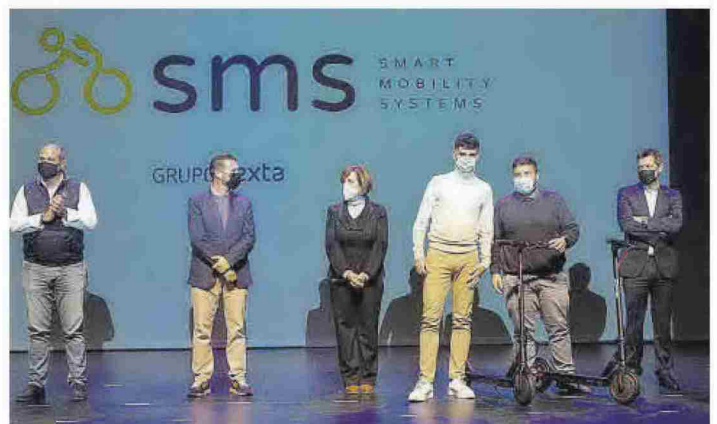
Tampoco faltó Gruponexta, que entregó dos patinetes eléctricos en la gala.