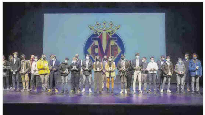
Todos los niños asistentes a la Gala del Tenis Provincial recibieron un obsequio.