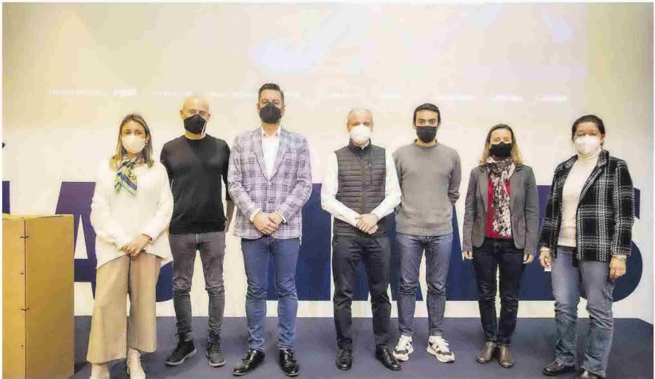
La cuarta jornada de los i-Talks congregó en Las Naves a algunos representantes del ámbito emprendedor de la Comunitat Valenciana.