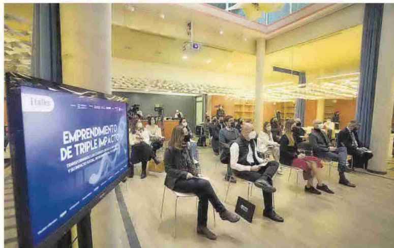
Los i-Talks son el ciclo de encuentros orientados al desarrollo económico organizados por Prensa Ibérica.

En este punto, es importante destacar que el 90 % de las pyme tienen