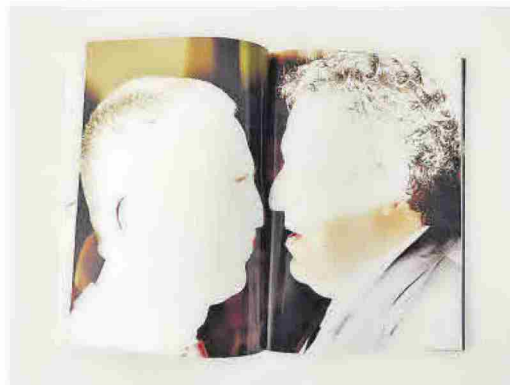
El fotollibre de Julián Barón es va publicar l'any 2011 i va causar un gran impacte en l'escena de la fotografia internacional pel seu contingut i forma.

amb aquestes puntuacions entre lletra i lletra; tot té el seu perquè—. El seu autor: Julián Barón. La seua repercussió: internacional i vigent encara avui. A través d'aquest treball, el castellanenc, gairebé sense voler—en més d'una ocasió ha reconegut que tot va partir d'un «error»—, va donar forma a una nova concepció de la fotografia documental. Tant va ser així que alguns experts van arribar a considerar la fotografia com a dispositiu comba-