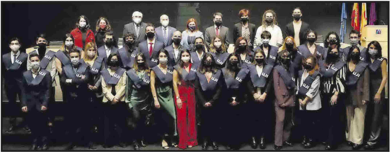
Grau en Enginyeria en Disseny Industrial i Desenvolupament de Productes.