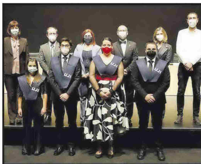
Grau en Arquitectura Tècnica.