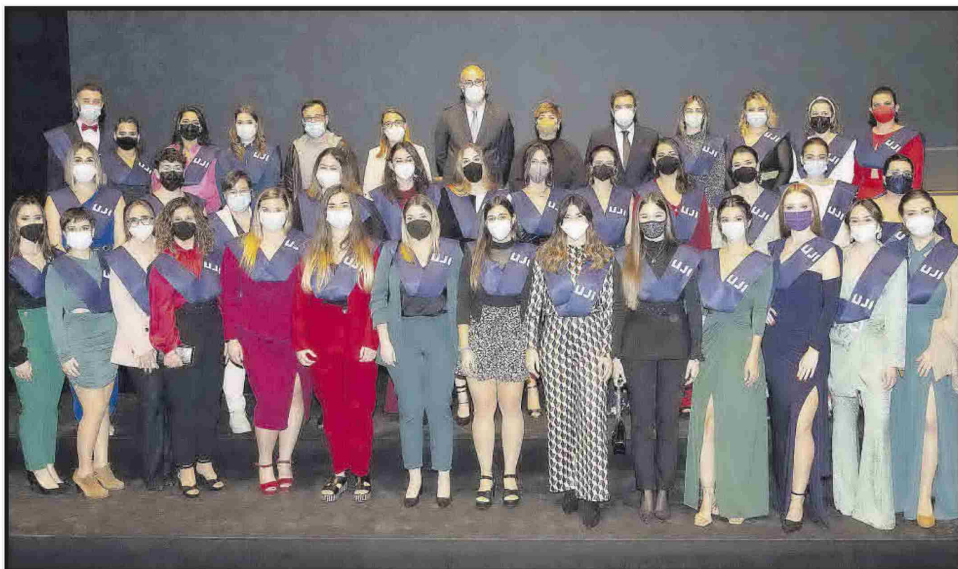
Grau en Mestre o Mestra d'Educació Infantil.