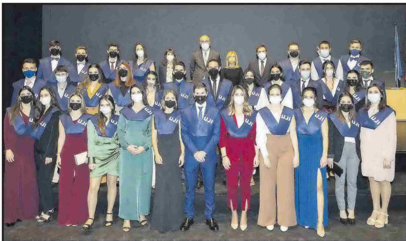
Grau en Mestre o Mestra d'Educació Primària.