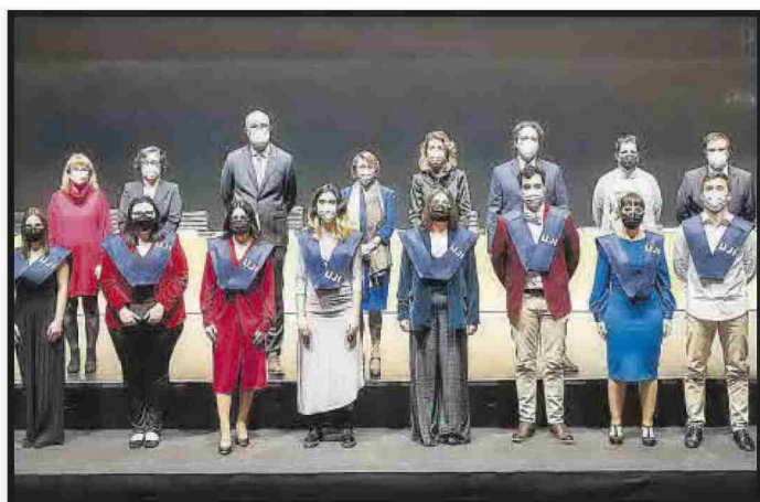
Grau en Història i Patrimoni.