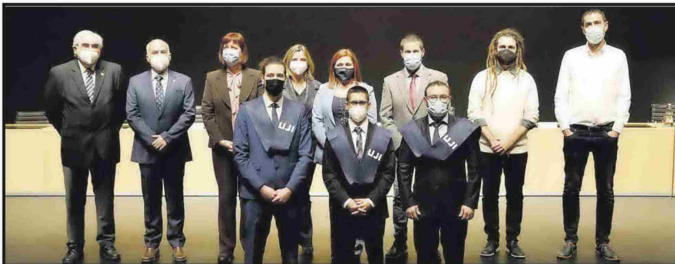
Grau en Enginyeria Elèctrica.