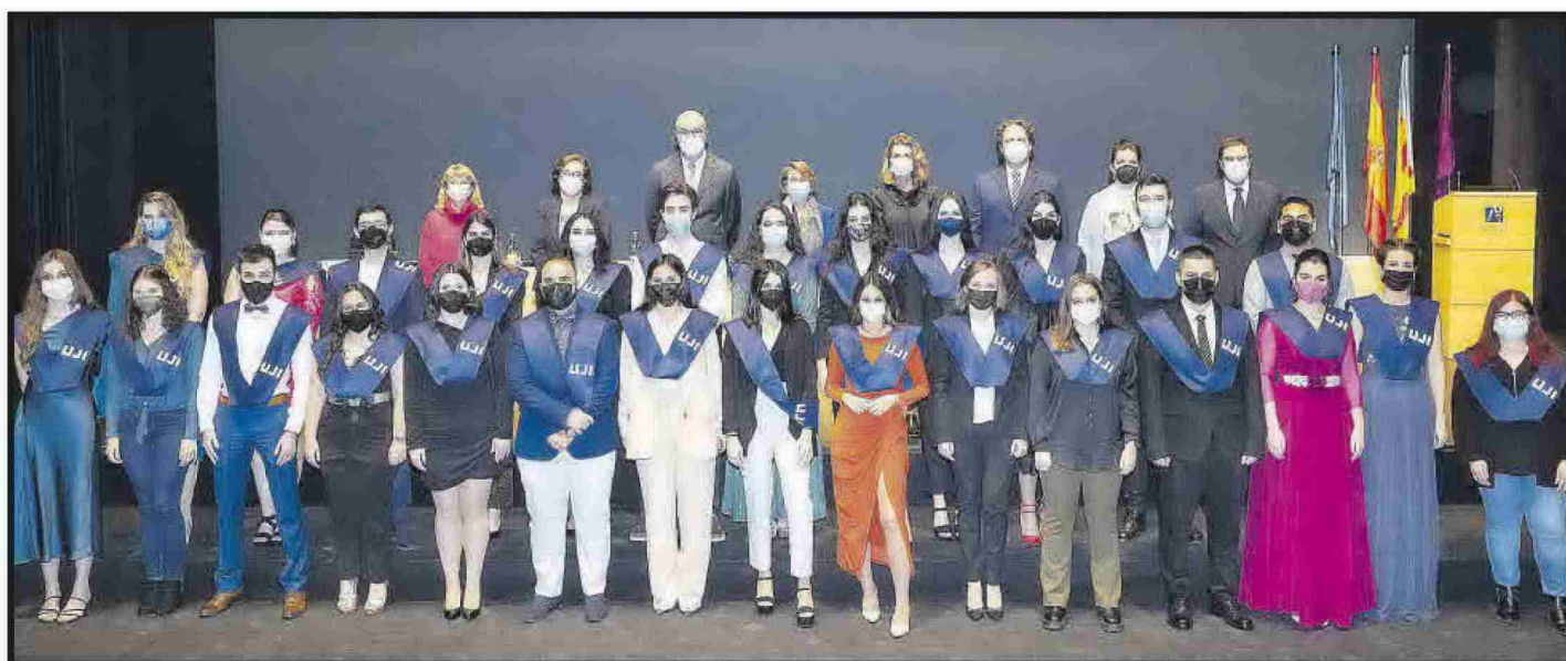
Grau en Estudis Anglesos.