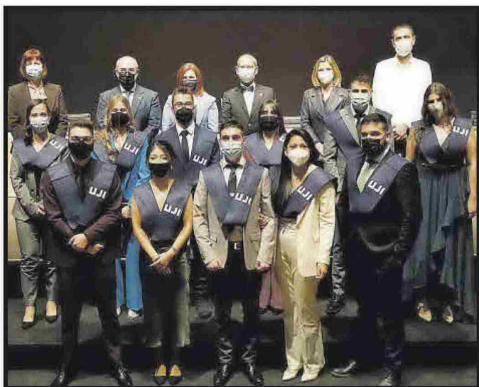
Grau en Enginyeria Agroalimentària i del Medi Rural.