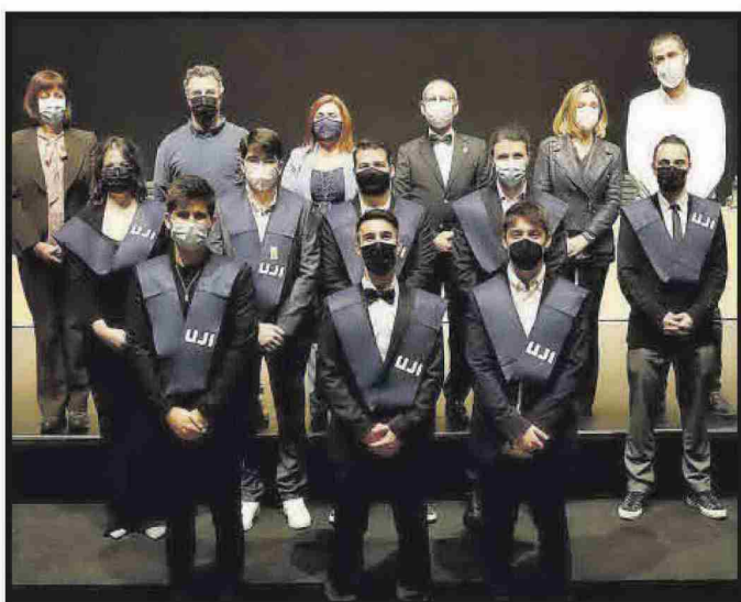
Grau en Disseny i Desenvolupament en Videojocs.