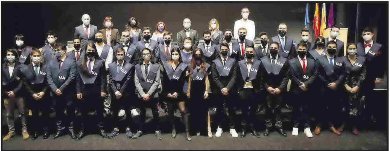
Grau en Enginyeria Informàtica.