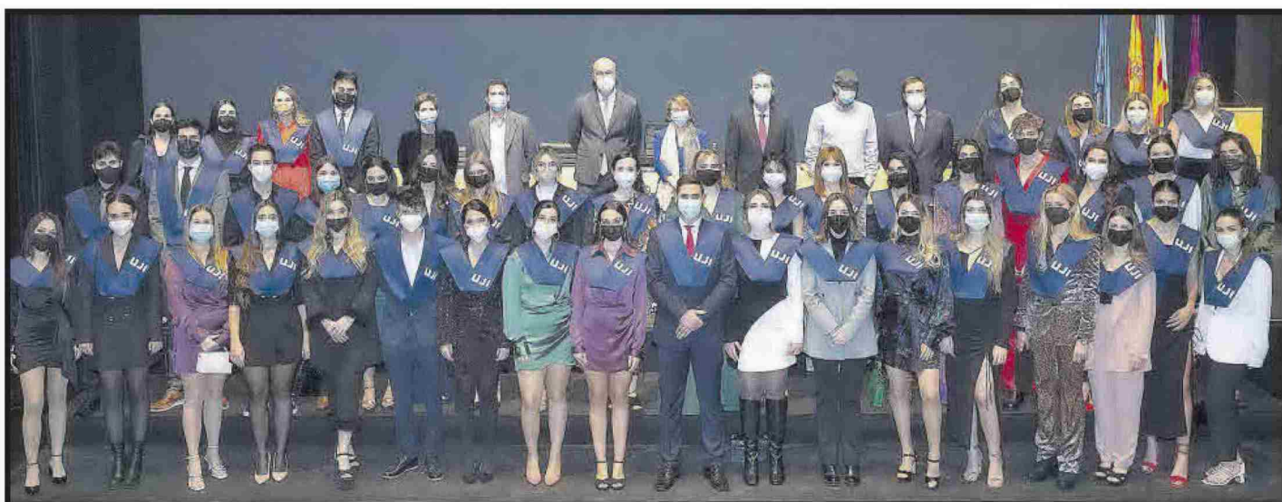
Grau en Publicitat i Relacions Públiques.