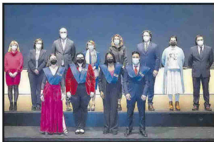
Grau en Humanitats i Estudis Interculturals.