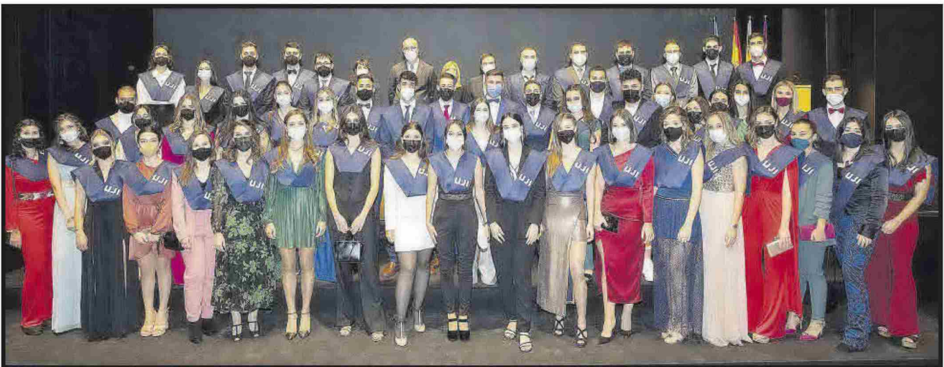
Grau en Mestre o Mestra d'Educació Primària.