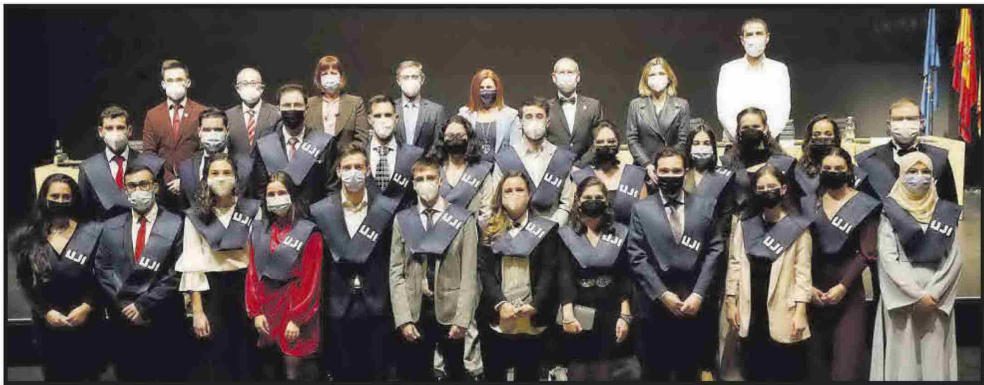
Grau en Química.