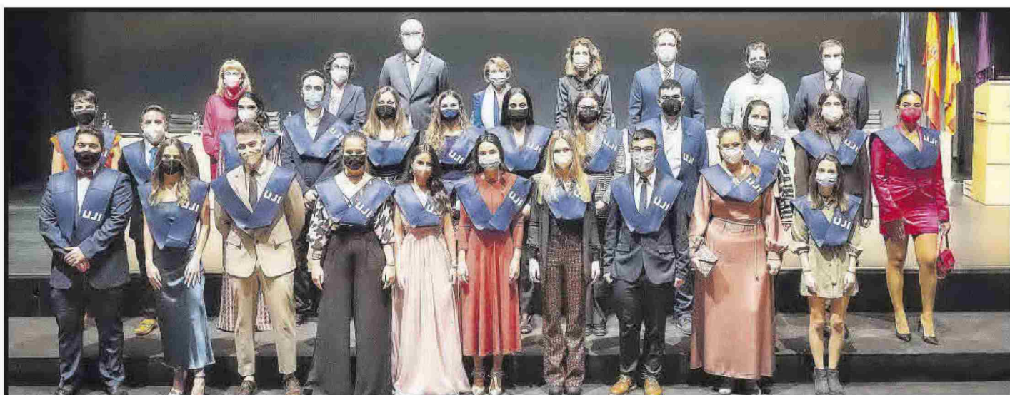
Grau en Traducció i Interpretació.