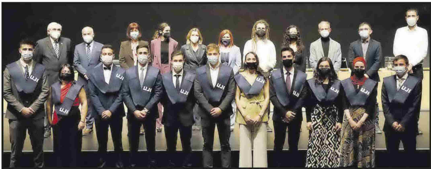
Grau en Enginyeria Química.