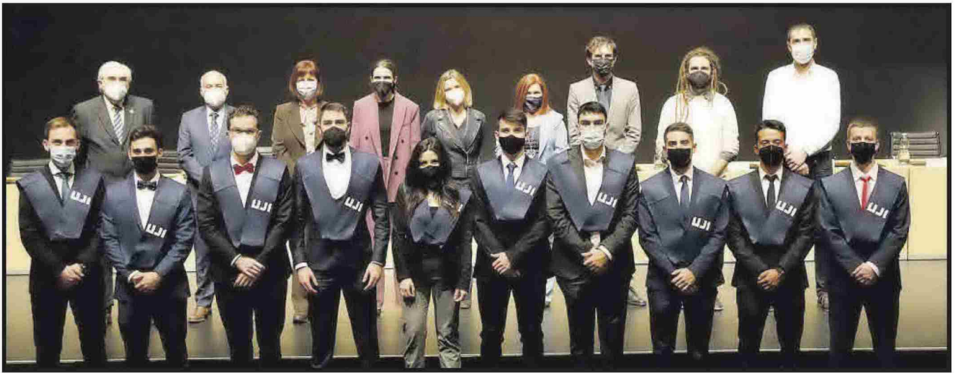
Grau en Enginyeria Industrial.