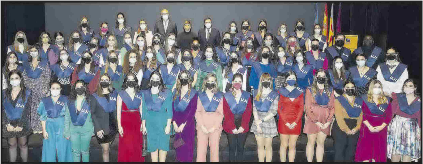
Grau en Mestre o Mestra d'Educació Infantil.