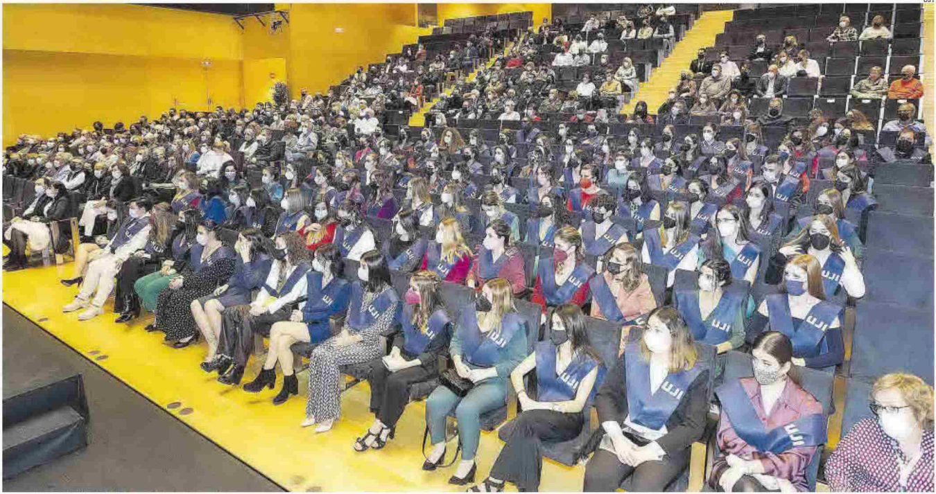
EMOCIÓ. El dia 13 va ser el torn de les titulacions de mestre/a en Educació Infantil i Primària, amb 235 graduats que van finalitzar els estudis en el curs 2020-2021 a la Universitat.