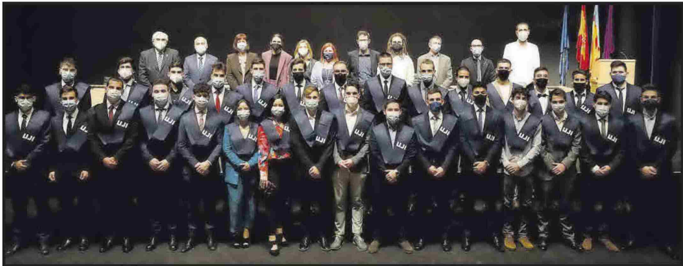
Grau en Enginyeria Mecànica.