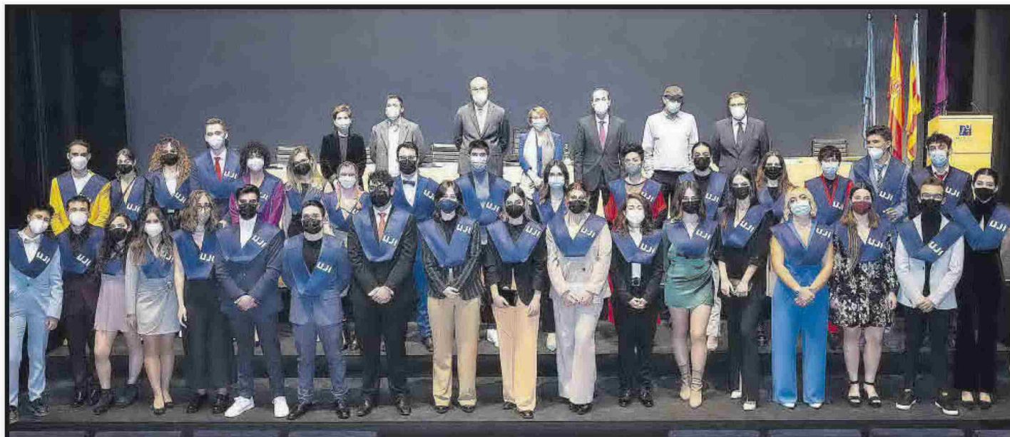
Grau en Comunicació Audiovisual.