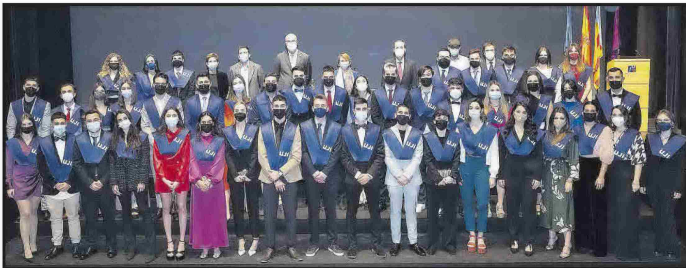
Grau en Periodisme.