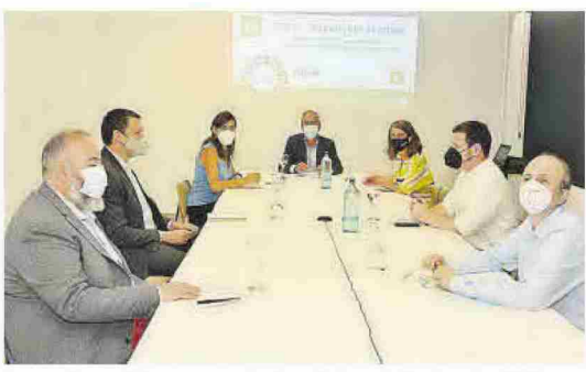
Imagen de una de las mesas redondas anteriores dedicadas a los ODS.

NOEMÍ GONZÁLEZ ngonzalez@epmediterraneo.com CASTELLÓN