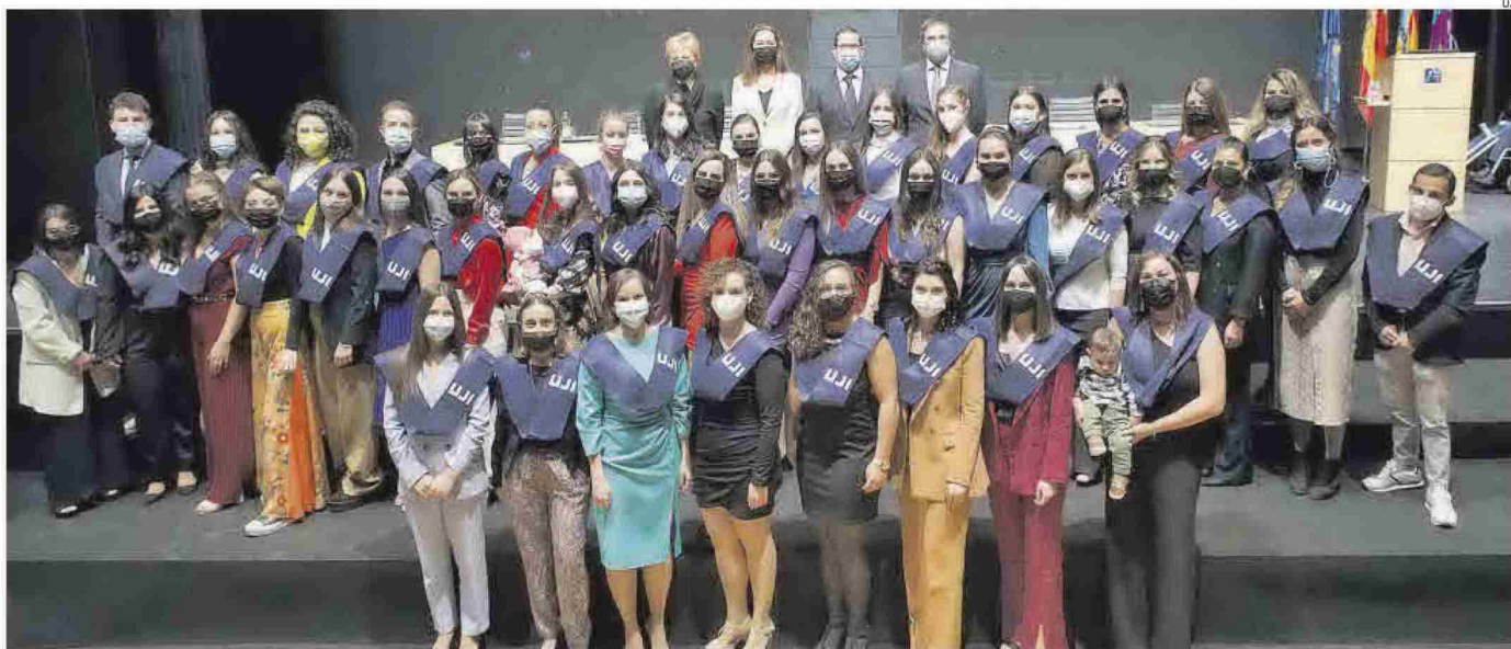
ORGULL. El estudiants del Grau de Mestre o Mestra d'Educació Infantil de la Universitat Jaume I que van finalitzar els estudis el curs 2019-2020, en la foto de família a l'acte de graduació.