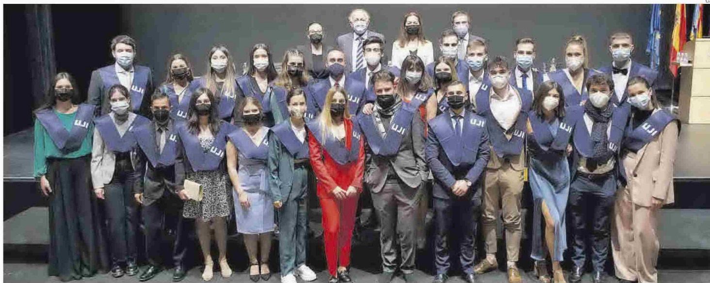
GRAU EN PERIODISME (2019-2020).