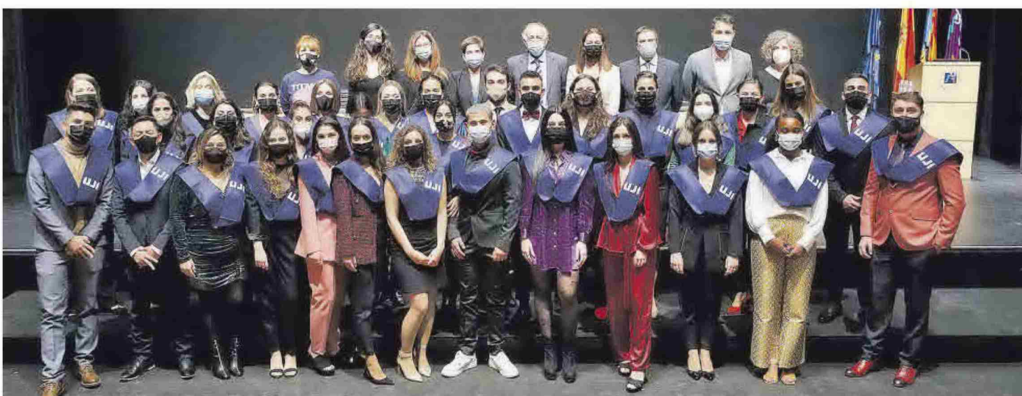
GRAU EN PUBLICITAT I RELACIONS PÚBLIQUES (2019-2020).