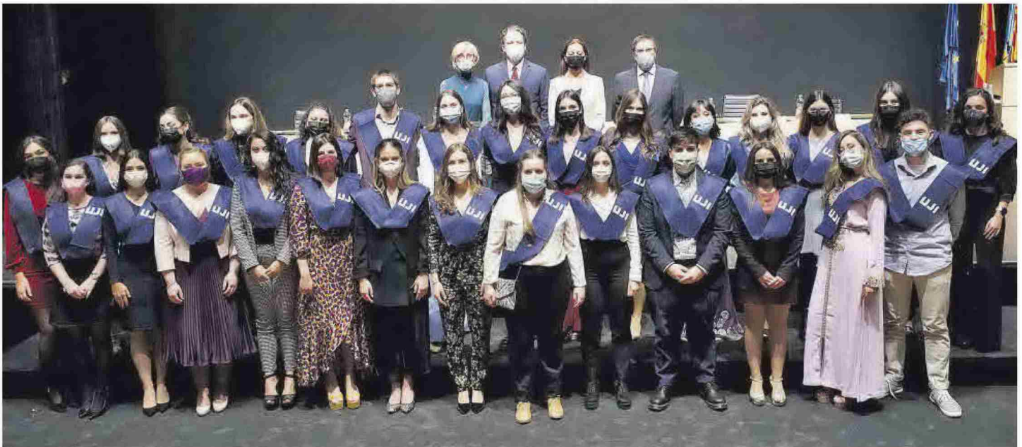
GRAU EN TRADUCCIÓ I INTERPRETACIÓ (2019-2020).