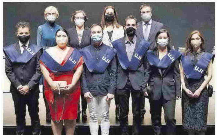
GRAU EN HISTÒRIA I PATRIMONI (2019-2020).