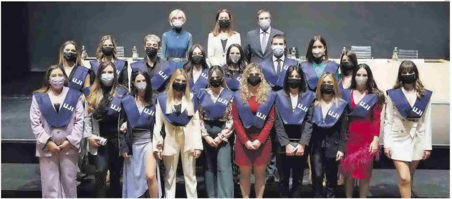
GRAU EN ESTUDIS ANGLÉSOS (2019-2020).