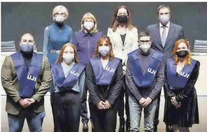
GRAU EN HUMANITATS: ESTUDIS INTERCULTURALS (2019-2020).