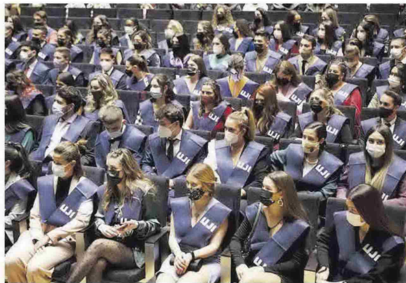
CELEBRACIÓ. Més de 300 alumnes van participar als actes de graduació que es van celebrar al Paranimf el 29.

Posteriorment es van celebrar les graduacions en Humanitats, Història i Patrimoni, Estudis Anglesos i Tra-