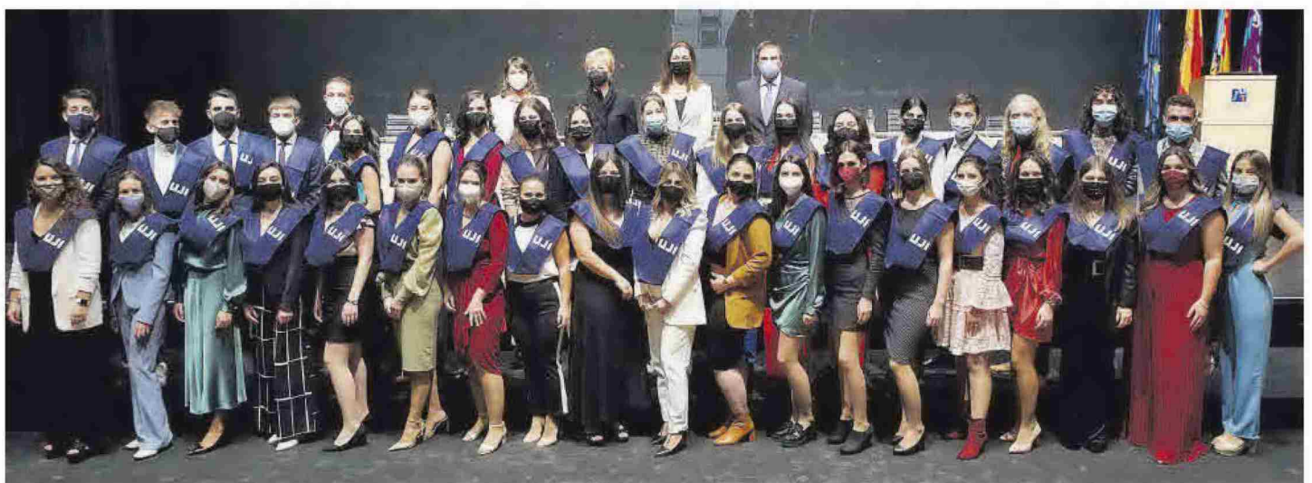
GRAU EN MESTRE O MESTRA D'EDUCACIÓ PRIMÀRIA (2019-2020).