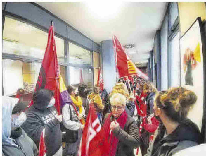
El rectorado de la UJI acogió ayer una manifestación con pancartas.