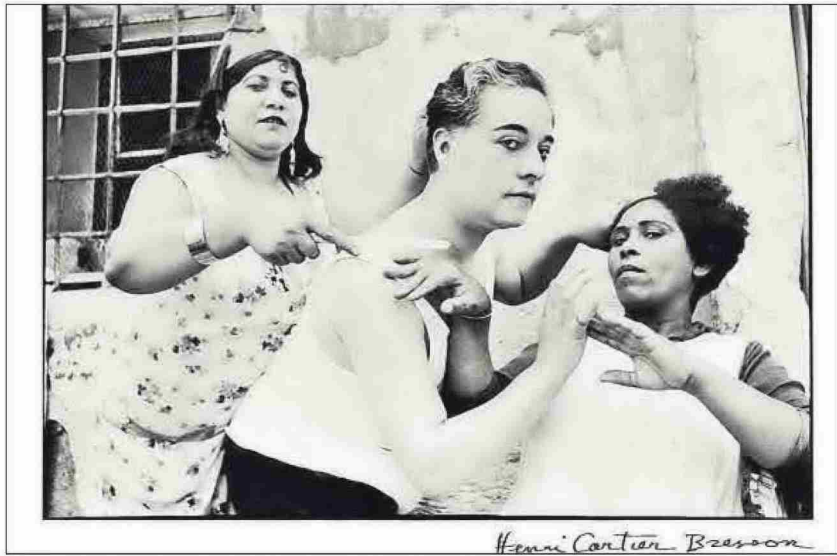
Dos de las imágenes tomadas en Alicante por Cartier-Bresson que se verán en el MACA.