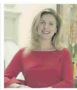
AMPARO MARCO ALCALDESA DE CASTELLÓ

que «las estadísticas muestran que España es un país cada vez más envejecido y las pensiones públicas no son muy altas. De hecho, la Comunitat Valenciana tiene unas pensiones por debajo de la media del país. Ante esta situación, se hace cada vez más necesario valorar fórmulas financieras que permitan a los mayores compensar la cuantía de sus subsidios». En base a esta premisa, Pedro Serrano señala que entre las opciones para la obtención de ingresos adicionales «las soluciones más efectivas serán aquellas que ayuden a monetizar el ladrillo», puesto que, de acuerdo con los da-