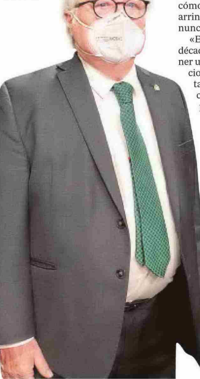
El ministro Manuel Castells

«inaplicable» en Cataluña, en tanto que la proporción de profesorado funcionario apenas alcanza en la mayoría de los centros el 30 por ciento. Así lo constatan las estadísticas de las universidades, consultadas por ABC.