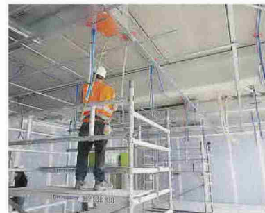
En la parte externa, la Facultad parece completamente finalizada, pero en el interior se despliega una actividad incansable para acondicionarla.