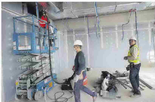
Instalaciones eléctricas y carpintería son algunos de los trabajos.