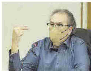
JAVIER NAVARRO PERIÓDICO MEDITERRÁNEO

«La existencia de un buen periodismo contribuye a la salud democrática de nuestras sociedades»