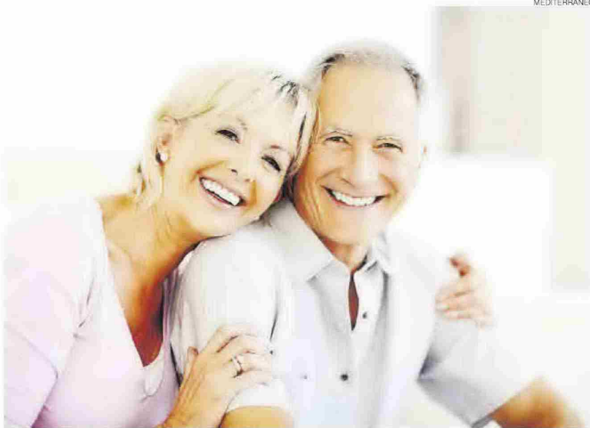
El desayuno informativo de Mediterráneo abordará las opciones financieras existentes más adaptadas a los mayores.