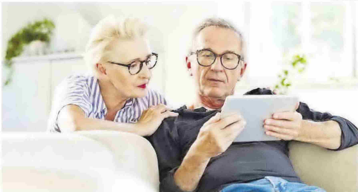
El evento en Castelló desgranará las últimas innovaciones financieras existentes en el mercado que se adaptan a las necesidades concretas de la tercera edad.

«Es un mercado que está latente y que la sociedad debería conocer porque aporta importantes ventajas a través de modalidades