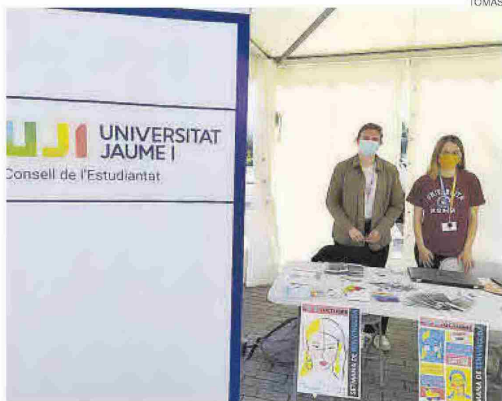
El Consell d'Estudiants, que esta semana celebra la Setmana de benvinguda.