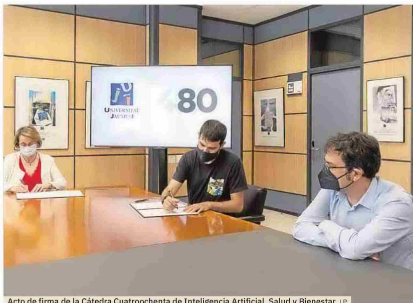
Acto de firma de la Cátedra Cuatrocienta de Inteligencia Artificial, Salud y Bienestar.

Las cátedras y aulas de empresa constituyen una de las fórmulas de colaboración entre la Universidad y la sociedad, un mecanismo innovador de interacción cooperativa en ámbitos específicos de mutuo interés. En definitiva, una alianza estratégica a través de la cual la empresa colabora en actividades y proyectos universitarios en el ámbito de la formación, la captación de talento, la investigación, la innovación, y la divulgación científica por-