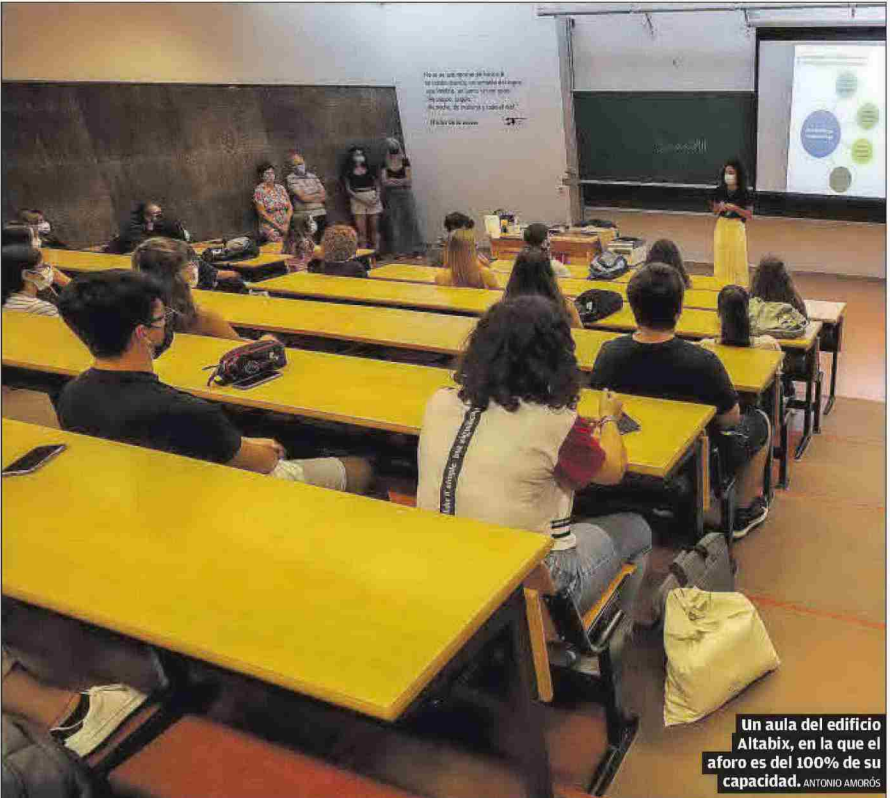
Un aula del edificio Altabix, en la que el aforo es del 100% de su capacidad. ANTONIO AMORÓS