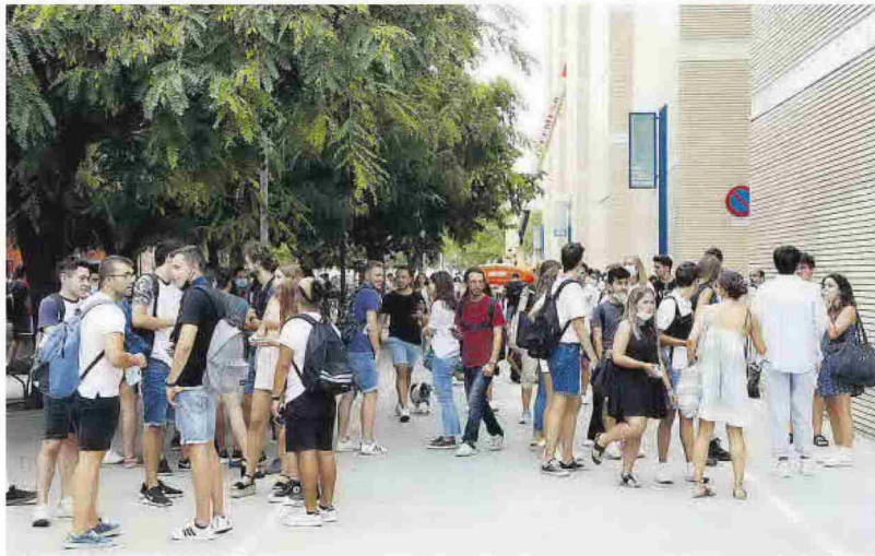
Los estudiantes universitarios vuelven a clase en el campus de Tarongers en València.