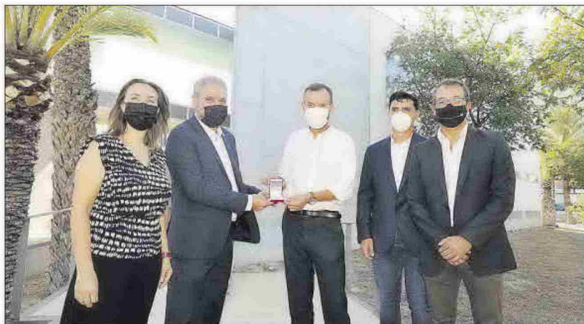
El alcalde hace entrega al rector de las llaves de la residencia, junto a ediles y vicerrectores.

«Hay iniciativas privadas a pequeña escala de ofertas de plazas universitarias. Y también hay empresas que nos han expresado su interés por ir un paso más allá y construir residencias universitarias de mayor dimensión, en el campus o en su entorno», mani-