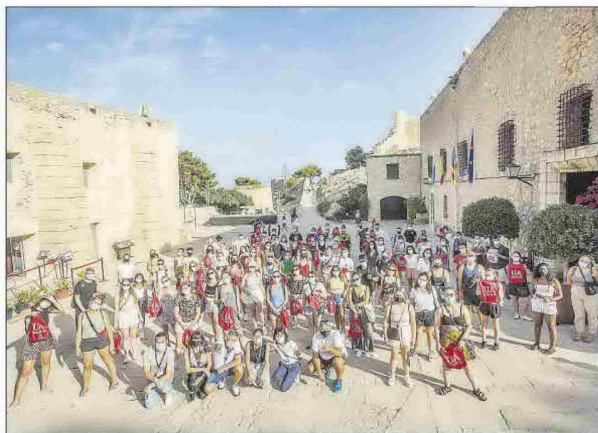
Los primeros extranjeros de este curso en la UA proceden de 23 países distintos.

Entre los europeos que han elegido la UA para combinar sus estudios universitarios desde varios meses a un año figuran este curso en primer lugar los alemanes, seguidos de Reino Unido, Italia y Francia. Si ampliamos e abanico al total de extranjeros, destacan de fuera de la UE la presencia de chi-