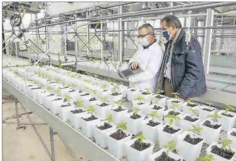
Investigadores de la Universidad de Alicante en el invernadero.