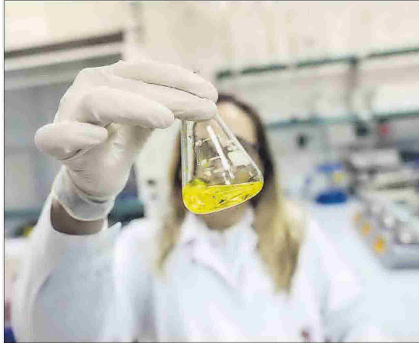
Una científica participa en una investigación impulsada desde la UMH.