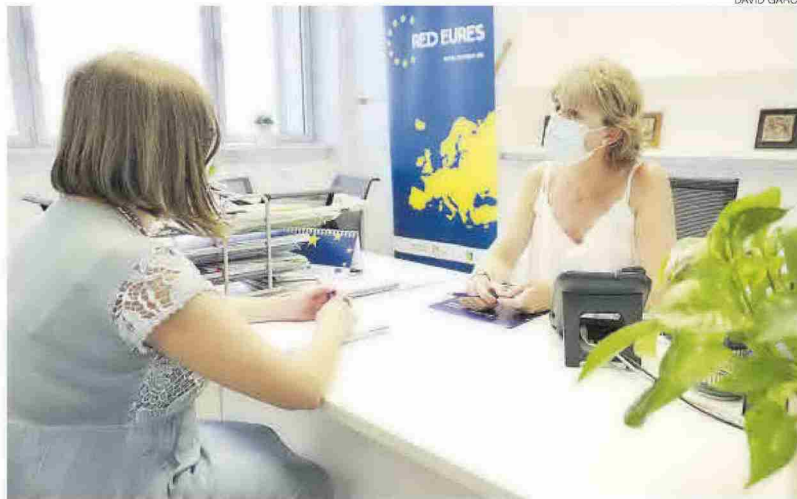
Desde la red Eures en Castellón asesoran vía telefónica o con cita previa presencial sobre ofertas de empleo en Europa

JÓVENES / El perfil sigue siendo joven y cualificado, sobre todo, maestros de Educación Infantil, fisioterapeutas e ingenieros. «Pero si antes el nº1 era Reino Unido (que ya no tiene ofertas de empleo en la red Eures), ahora el principal destino es Irlanda –incluso teniendo cuarentenas–, sobre todo, maestros de Infantil que van a cadenas de guarderías. Se nota más el impacto del brexit que la pandemia», relata. Le sigue Francia (en abril-mayo buscan fisioterapeutas en centros termales), Alemania (geriátrica con experiencia en cuidado de mayores y educación infantil), Suecia y países nórdicos (para hostelería (camareros, chefs...), en Luxemburgo y Bélgica (ingeniería informática, especialistas digitales y desarrolladores de programas, al alza por la pandemia; y menos, de finanzas). «La rama sanitaria la pide toda Europa, pero ya no hay peticiones desde Castellón porque tienen trabajo aquí mientras duren los contratos de refuerzo por la pande-