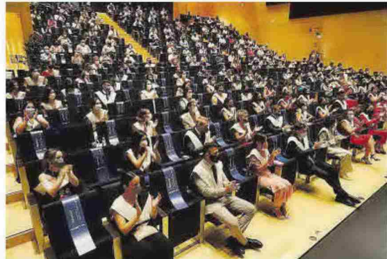
Los egresados del Grado de Enfermería y los egresados del Grado de Medicina se dieron cita el viernes en el Paranimf de la universidad de Castellón.