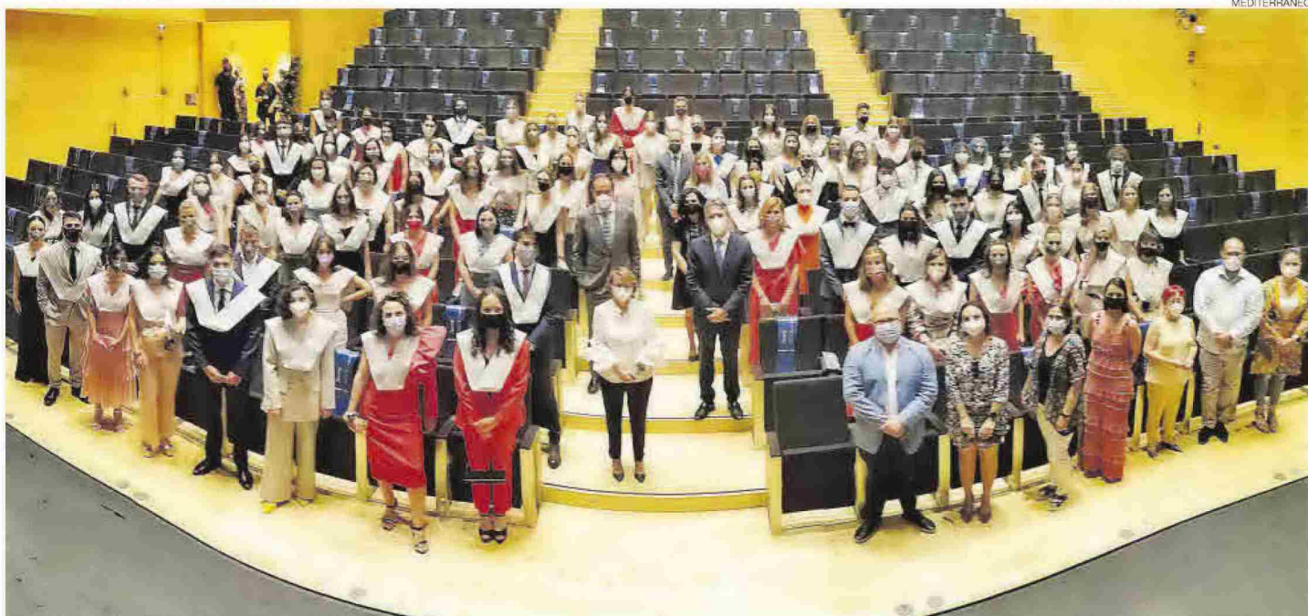
► El Grado de Enfermería de la Universitat Jaume I ha contado en este curso 2020-2021 con 52 estudiantes graduados. Y otros 42 egresados, del curso 2019-2020, en el acto de graduación.