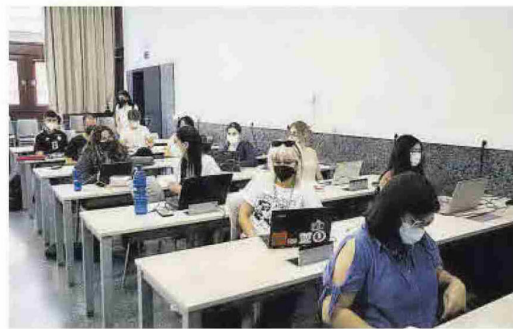
Estudiantes de la UV, ayer, en un aula con nuevo mobiliario. GERMÁN CABALLERO

► Los andamios ya se retiran del edificio sur de Tarongers pero aún quedan cinco meses de trabajo para reforzar la otra fachada ► La Universitat de València renueva la electrificación y el mobiliario de 40 aulas