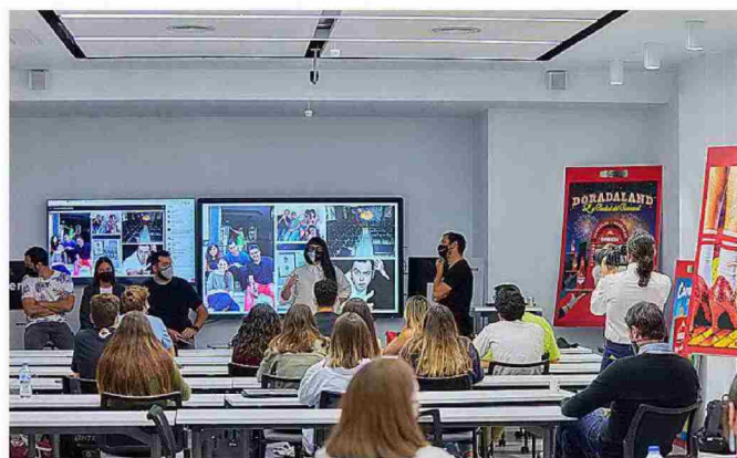
EUROPEA DE CANARIAS

Esta institución trata de diseñar títulos vinculados a las necesidades actuales de la sociedad como es el máster en Big Data & Business Analytics. En 2020 inauguró sus nuevas instalaciones en Santa Cruz de Tenerife: nueve aulas de última generación distribuidas en 1.400 m 2 que acogen las titulaciones del área de Ciencias Sociales.