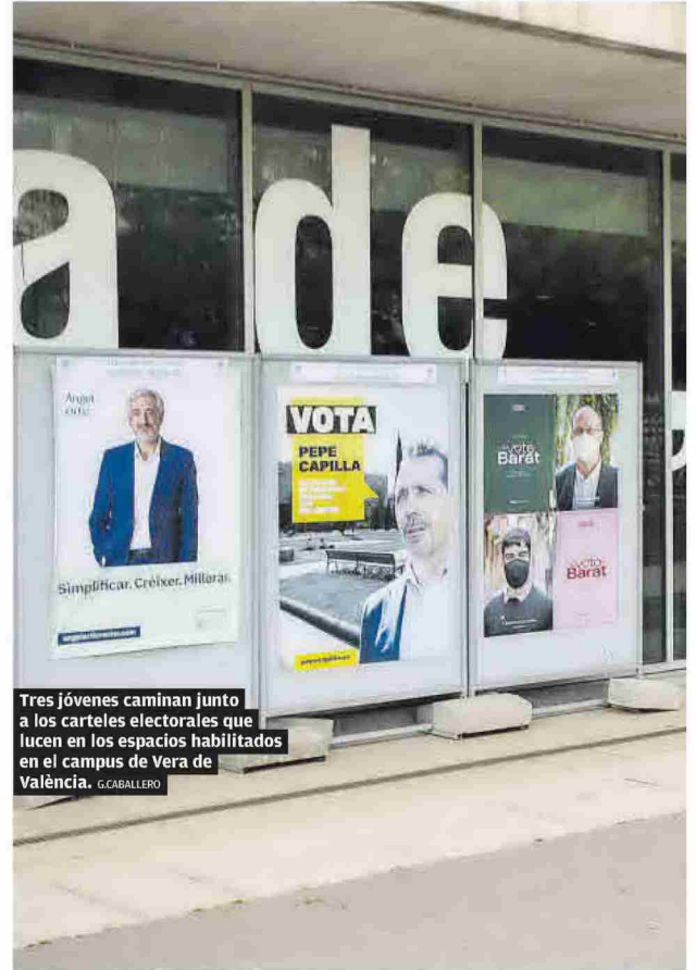
Tres jóvenes caminan junto a los carteles electorales que lucen en los espacios habilitados en el campus de Vera de València. G.CABALLERO

De momento, la crisis sanitaria ha impulsado la decisión de la Politécnica de organizar unos comicios por internet, lo que también está por ver cómo influirá en la participación que, en la última ocasión fue solo del 11 %, al no haber varios candidatos. Por una parte, con el sistema telemático parece más fácil y accesible votar, sin tener que realizar el «esfuerzo» de acudir a los puntos habilitados pero, por otro lado, se pierde el componente social que supone juntarse en persona para depositar la papeleta en la