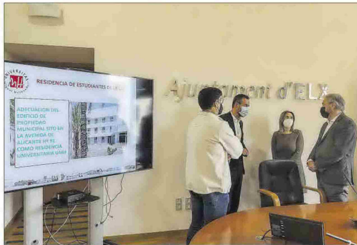
Un instante de la presentación del proyecto, ayer, en la Sala del Consell del Ayuntamiento.