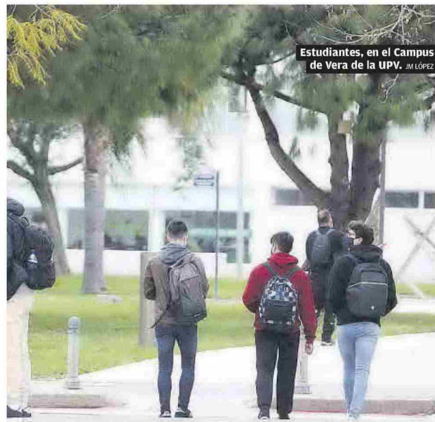
Estudiantes, en el Campus de Vera de la UPV.

que las carencias que marca el informe son el resultado de «años sometidos a una tasa de reposición que no nos permite la contratación de profesorado».