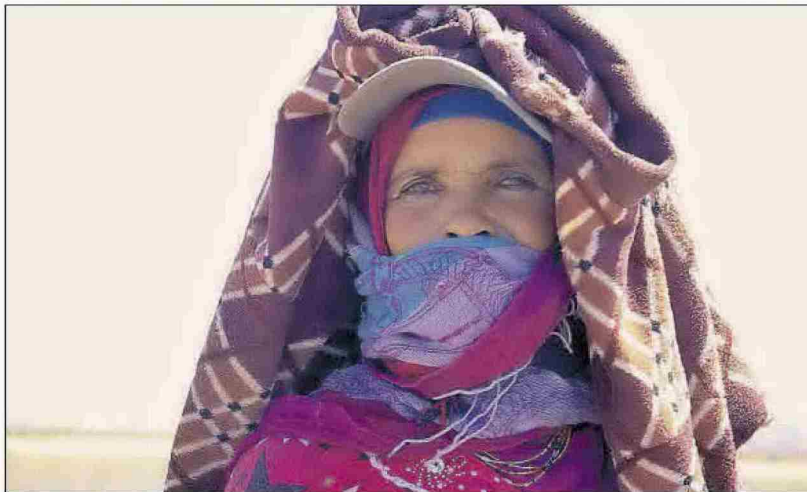
Un ejemplar de tortuga, junto a parte del equipo en Marruecos y la imagen de una pastora.