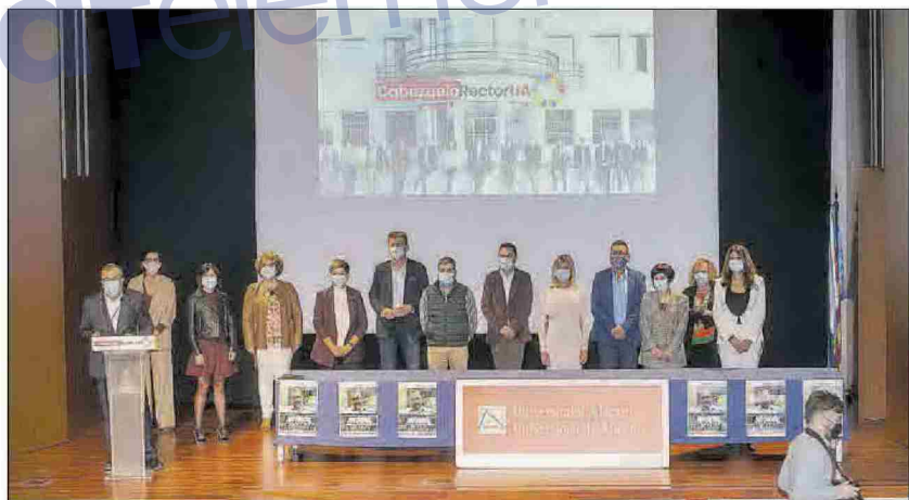
Los integrantes de la candidatura posan en el acto de presentación en la UA.