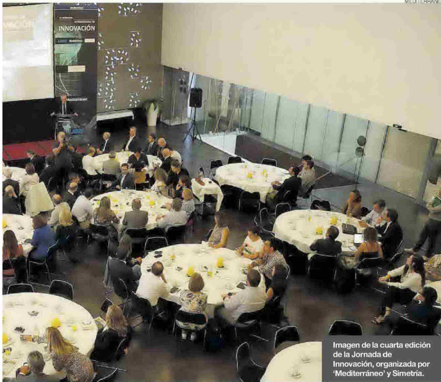
Imagen de la cuarta edición de la Jornada de Innovación, organizada por 'Mediterráneo' y Simetría.