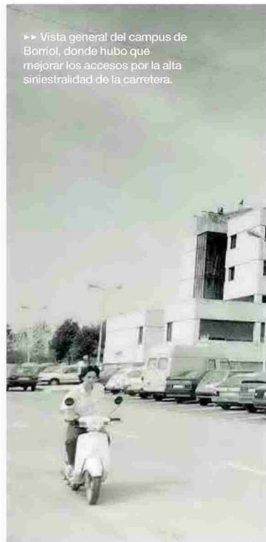
► Vista general del campus de Borriol, donde hubo que mejorar los accesos por la alta siniestralidad de la carretera.

Con la aprobación, en marzo del 1978, del régimen preautonómico de la Comunitat Valenciana el destino de CUC empezó a cambiar, dado que la educación fue