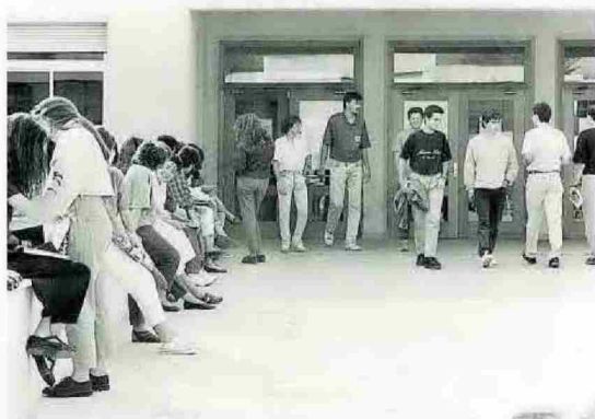
► El primer edificio del campus de Borriol se inauguró en 1982.