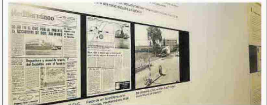
▶ Portadas y artículos de 'Mediterráneo' que se muestran en el Menador.

El CUC abrió la historia de los estudios superiores en Castellón y, para conmemorar el medio siglo de su nacimiento, la Jaume I ha organizado la exposición 50 anys del CUC, els fonaments de la nostra universitat . La muestra puede verse en el Menador espai cultural y estará abierta al público hasta el próximo 5 de noviembre.