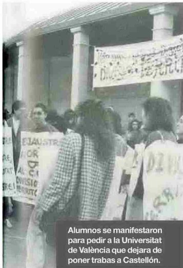
Alumnos se manifestaron para pedir a la Universitat de València que dejara de poner trabas a Castellón.