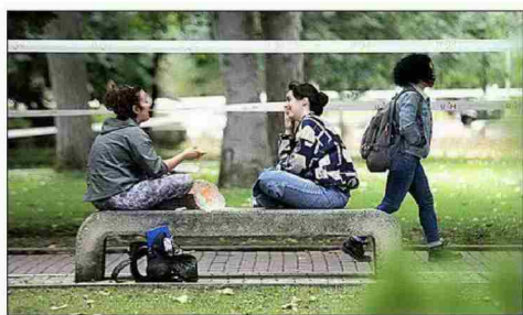
Alumnas de la Autónoma de Madrid junto al césped clausurado.

► AIRE LIBRE. El ministro Castells recomendó dar clases al aire libre, una medida que, sin embargo, desaconseja la mayoría de campus. Sólo la Autónoma de Barcelona o Granada van a utilizar los patios y el césped como aulas alternativas mientras el clima lo permita.