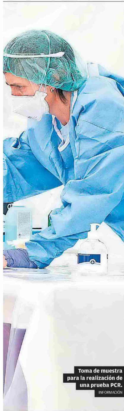
Toma de muestra para la realización de una prueba PCR.