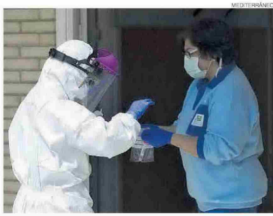
▶ La proliferación de brotes acapará parte del monográfico de hoy.

▶ La evolución de la pandemia en la provincia será uno de los ejes argumentales