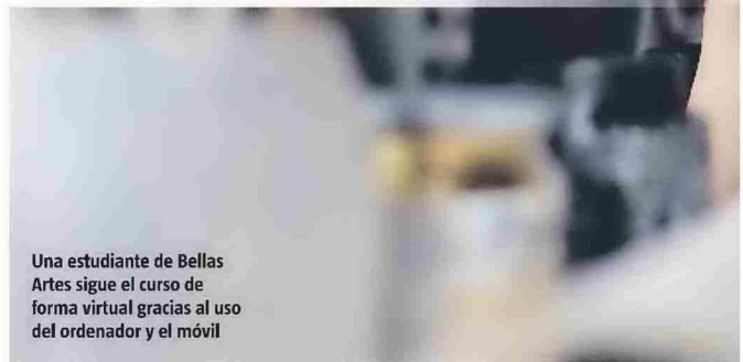
Una estudiante de Bellas Artes sigue el curso de forma virtual gracias al uso del ordenador y el móvil