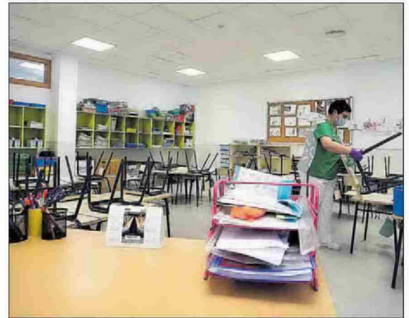
Limpieza en el CEIP 103 de València.

duales como para las clases de repaso con grupos de 10 alumnos, se establece que los centros comunicarán a las familias y alumnos los días y horas en las que se llevarán a cabo las actividades con el fin de concretar las citas previas y la organización de los grupos reducidos. Todo ello, apuntaron desde la Conselleria de Educación, «bajo un control estricto de seguridad», y entre las 9 y las 13 horas.