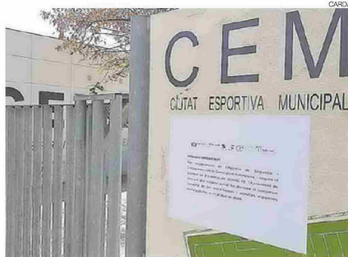
▶ La Ciutat Esportiva Municipal (CEM) es uno de los recintos a reabrir.