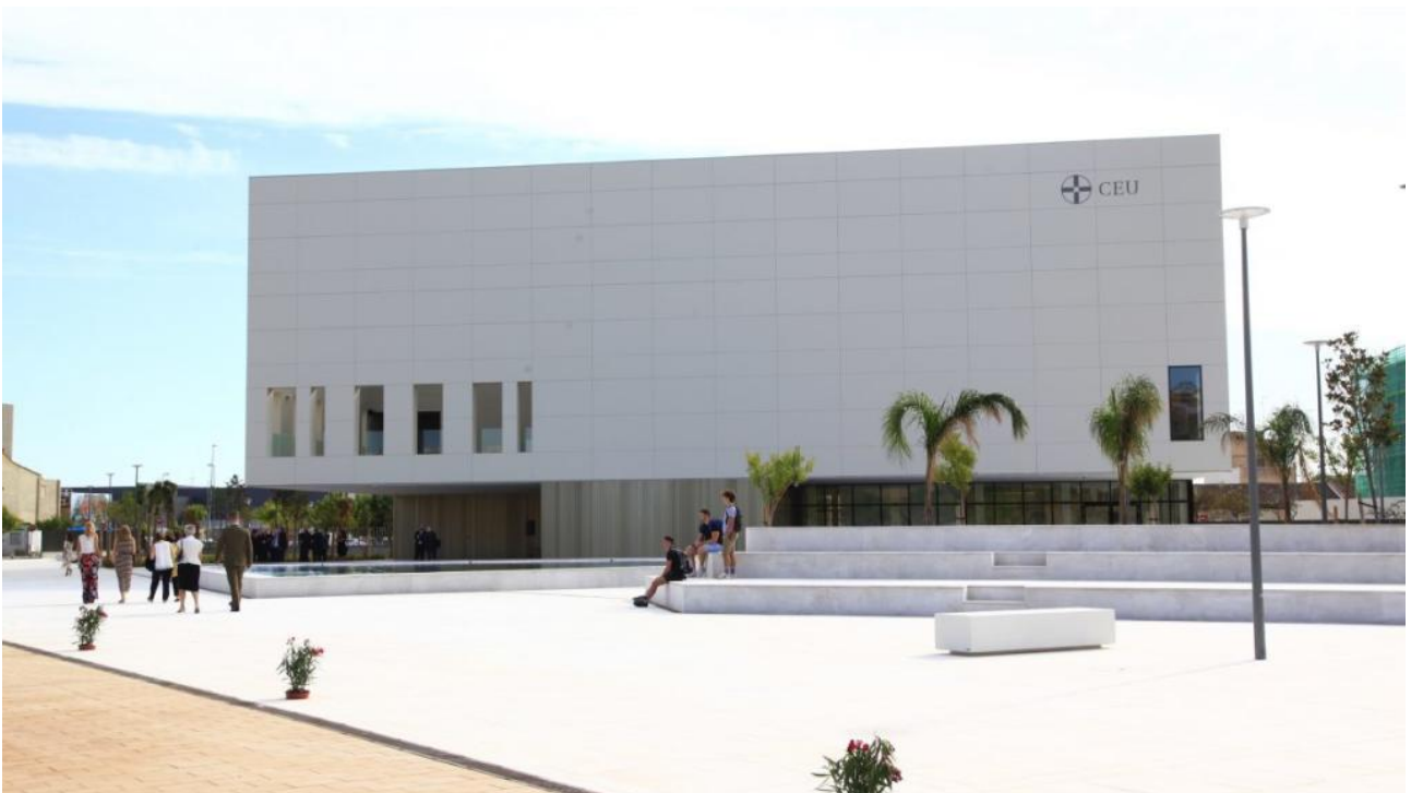
Universidad CEU Cardenal Herrera.

CEU Cardenal Herrera, amplia oferta de postgrados