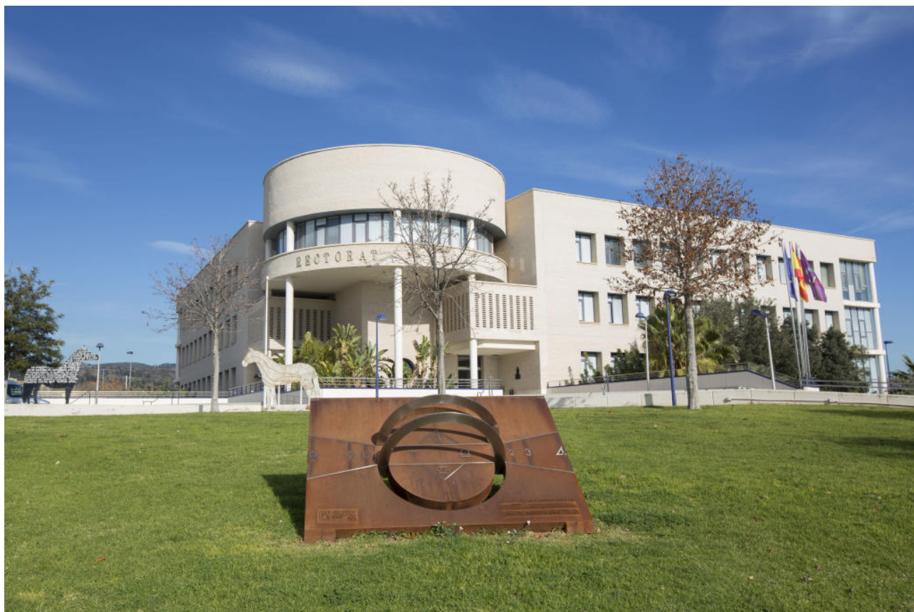
Universitat Jaume I.

La oferta de la UJI está concebida para satisfacer las necesidades de especialización que demanda el estudiantado y el sector profesional . Para el curso 2020/2021, la UJI ofrece 32 grados en todas las ramas de conocimiento, un doble grado en ADE-Derecho y tres Dobles Titulaciones Internacionales. Respecto a la oferta de postgrado, para el próximo curso la universidad de Castelló oferta 42 másteres universitarios , que incluyen Erasmus Mundus; 21 programas de doctorado ; 11 cursos de especialización ; y 22 cursos de experto o experta .