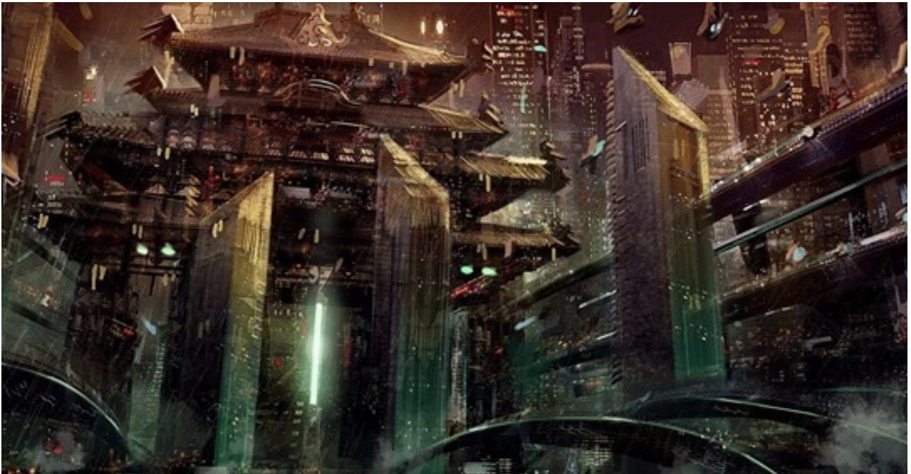
Universal Arts School.

La UA School , pionera en el campo de la creación de imagen , oferta tres nuevos másteres y abre el proceso de admisión para el próximo curso. Se trata de una escuela que convierte la expresión artística en su valuarte y ofrece, con este fin, un sinfín de recursos, también en la esfera digital a través de la animación , la realidad aumentada y los videojuegos .