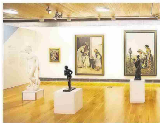
► La muestra 'Històries, mirades, dones' se podrá visitar a partir del 18.

turales? Esa es la gran pregunta y cuya respuesta, aunque siempre pendiente de nuevos anuncios por parte del Ministerio de Sanidad para pasar de la fase 0 a la 1 del desconfiamento, empieza a vislumbrarse. Así, por ejemplo, el 18 de mayo, el Museu de Belles Arts y el Espai d'Art Contemporani abrirían sus puertas de nuevo coincidiendo, además, con la celebración del Día Internacional de los Museos. «Siguiendo las medidas previstas se aperturarían estos dos espacios y lo harían con una tercera parte del aforo», explica Ribes, para añadir que «hemos planteado grupos de 30 personas máximo en el Museo y unas 15 en el EACC, y tenemos mascarillas y gel hidroalcohólico para asegurar la higiene de los visitantes y de los espacios».