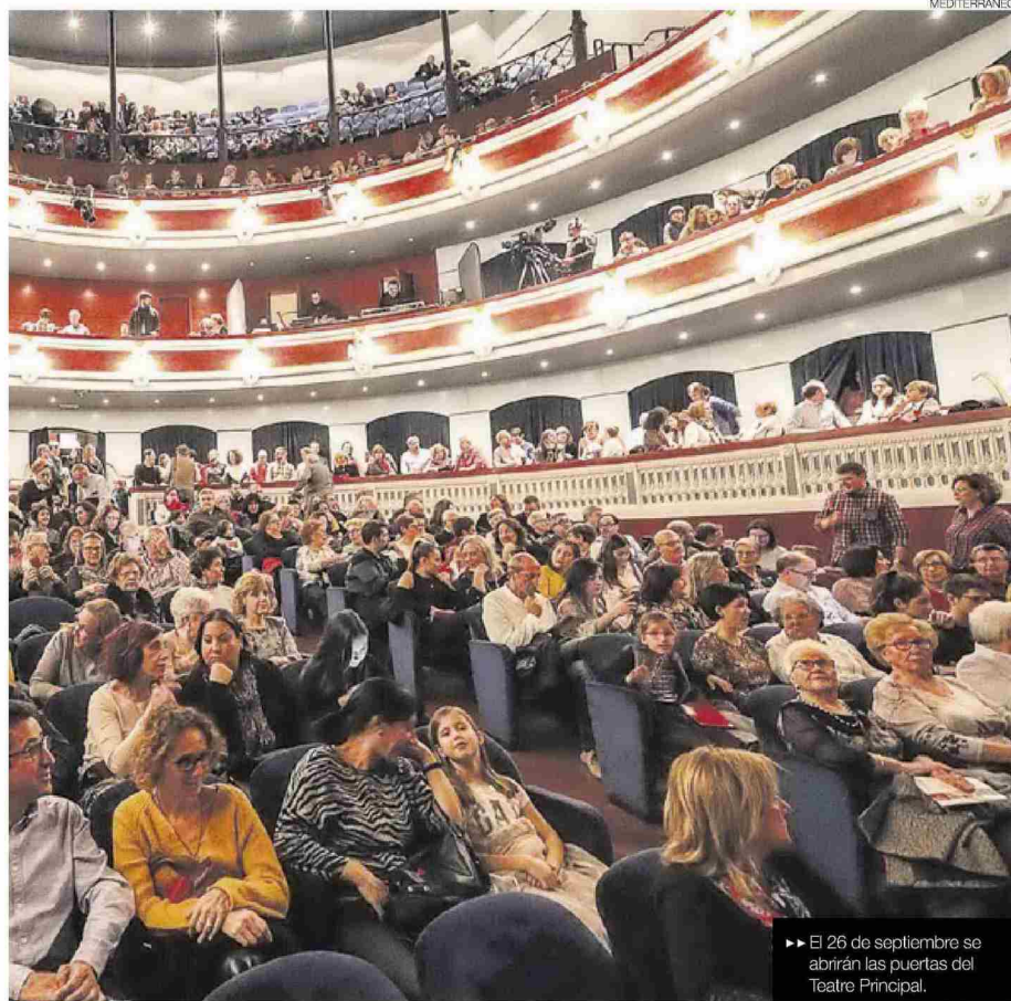
► El 26 de septiembre se abrirán las puertas del Teatre Principal.