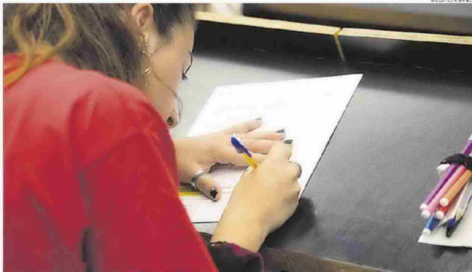
► Los alumnos se enfrentarán a las pruebas de acceso a la universidad los días 7, 8 y 9 de julio.

DECLARACIONES DE PILAR EZPELETA, DIRECTORA GENERAL